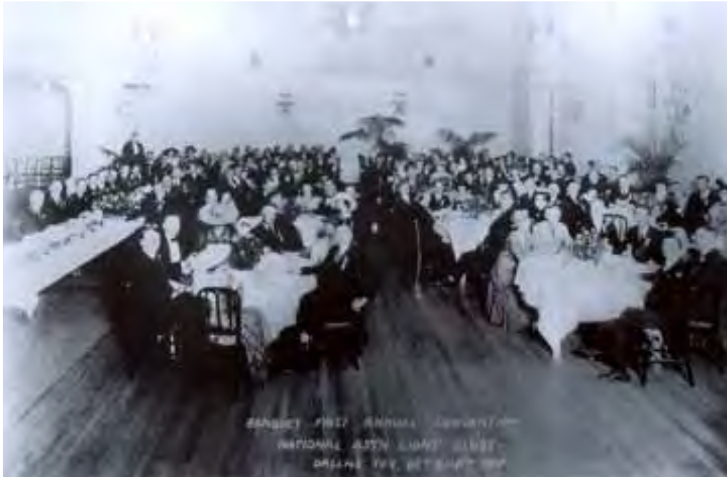
▲第一次年會的晚宴