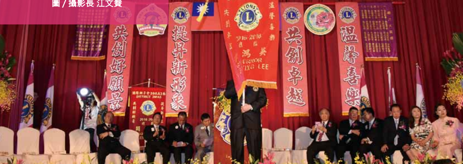
圖 / 攝影長 江文發