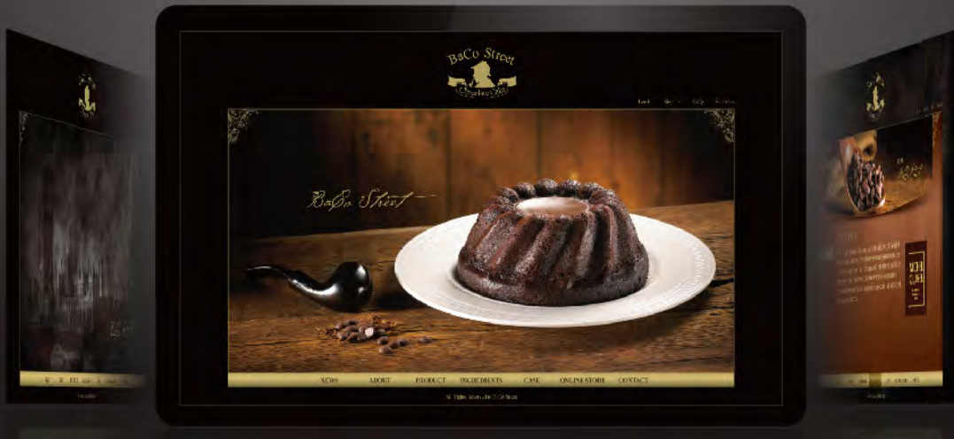
BaCo Street 網站識別規劃