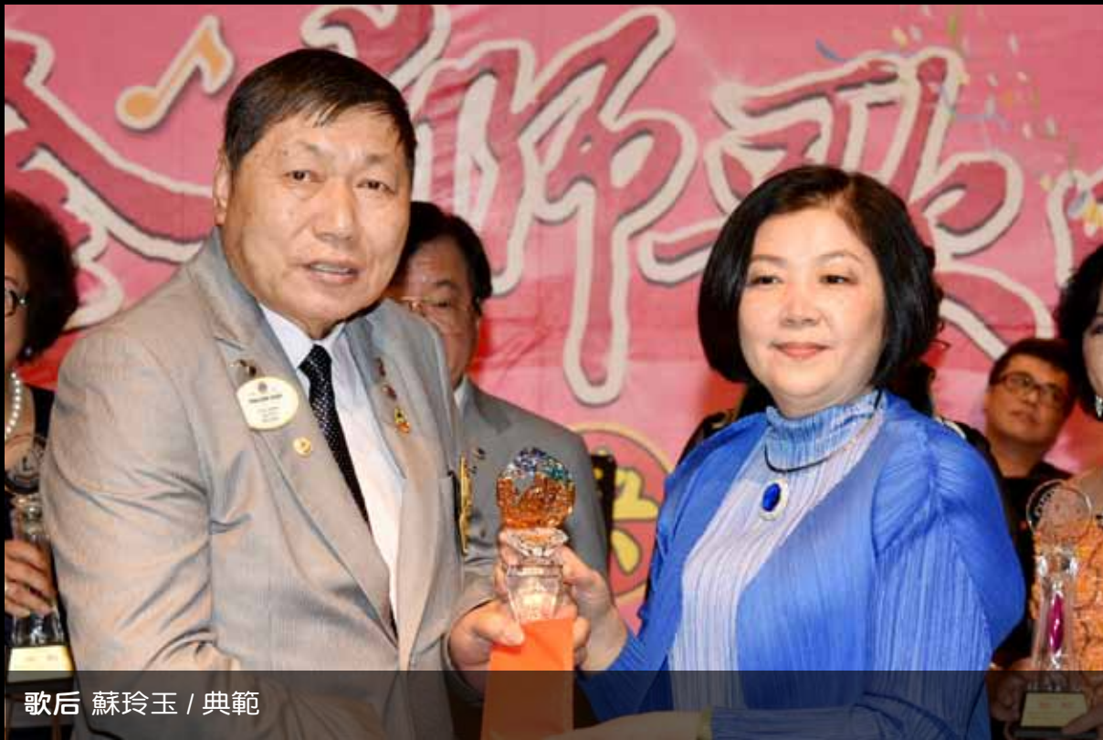
歌后 蘇玲玉 / 典範