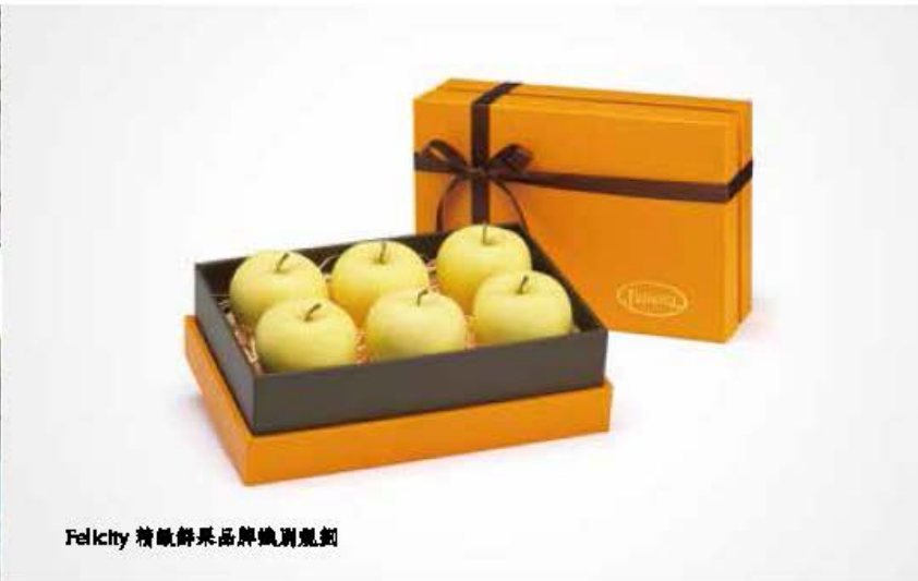
Felicity 精緻鮮果品牌識別規劃