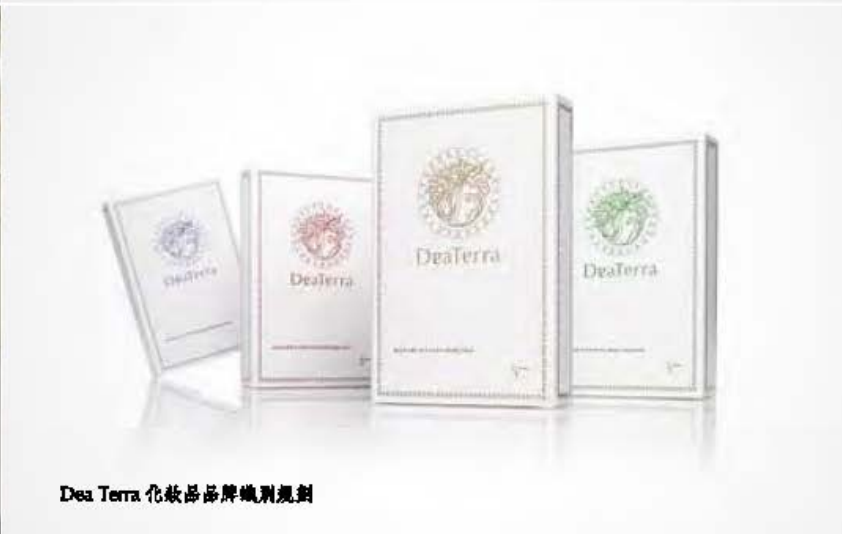
Dea Terra 化妝品品牌識別規劃