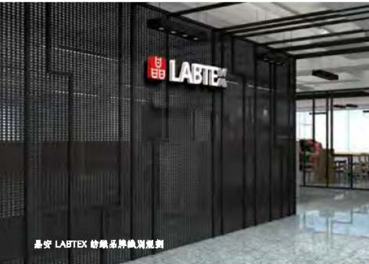
晶安 LABTEX 紡織品牌識別規劃