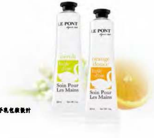
香港精肉 Le Pont 護手乳包裝設計