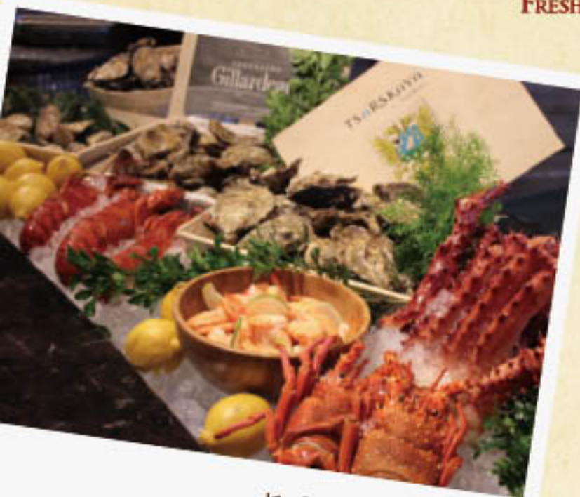
極黑和牛 海陸饗宴