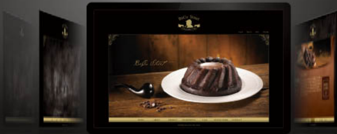
BaCo Street 網站識別規劃

越來越多的商業活動在網際網路上發生，網際網路本身即是虛擬市場。充分利用網路的優勢，也是企業發展的極佳機會。