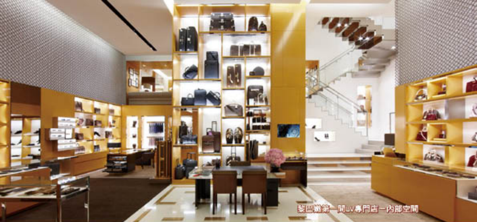
黎巴嫩第一間LV專門店—內部空間