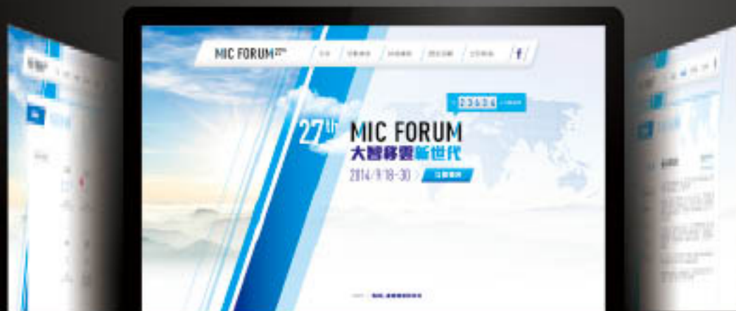
資訊會MIC-FORUM活動網站識別規劃