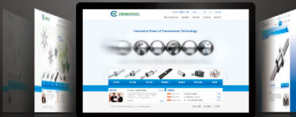
全球傳動網站識別規劃