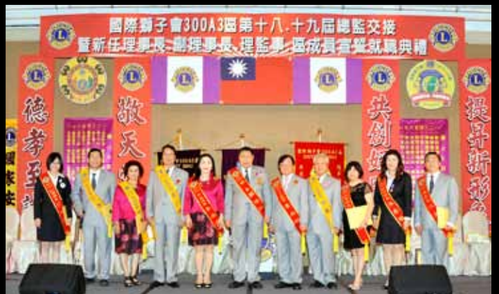
常務理監事暨總監團隊