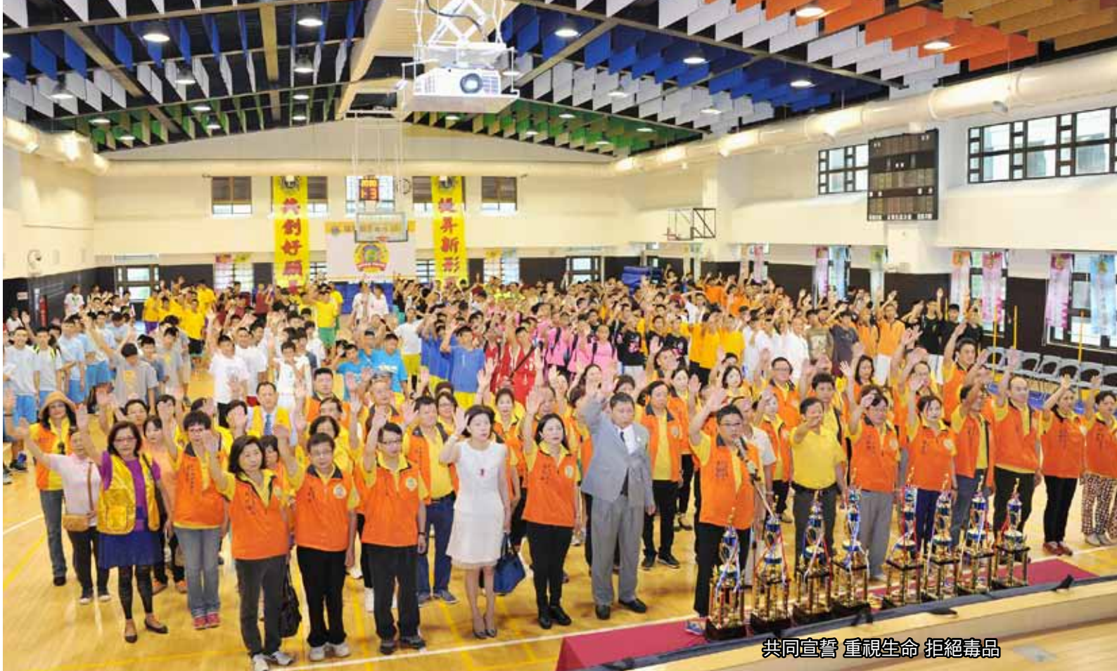
共同宣誓 重視生命 拒絕毒品

健康、安全、無毒的校園，需要社區、學校、家庭及你我共同努力及持續守護。感謝台北市教育局的指導和合辦。感謝北市松山工農全新的場地租借和協辦。感謝前國際理事江達隆獅友，帶來國際總會長的鼓勵和肯定。感謝榮譽副議長劉奕棋前總監，帶來台灣總會議長的支持與勉勵。讓我們一同藉由青少年喜歡的籃球活動，結合國、高中三十二個隊伍，六百四十位隊員，深入校園揮灑青春汗水，團結互助合作，爭取學校榮譽，並共同宣誓【只要青春，不要毒駭】【青春正夯，無毒有我】【重視生命，拒絕毒品】【為愛拒毒，永保幸福】反毒誓言，以此活動，啟發青少年對反毒有更深刻的認知，並提升青少年重視正當休閒娛樂活動的興趣。