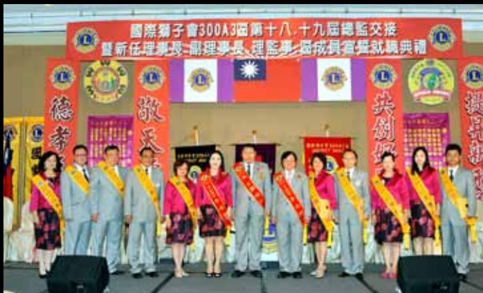
第一分區至第十分區主席