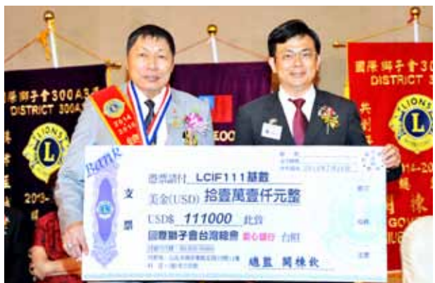
▲關總監熱心公益，捐贈愛心款項。