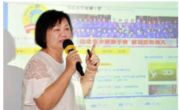
▲績優分會網頁分享。