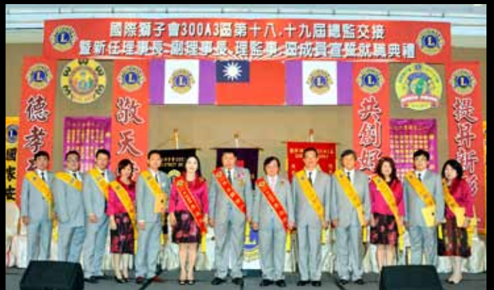
第十一分區至第二十分區主席