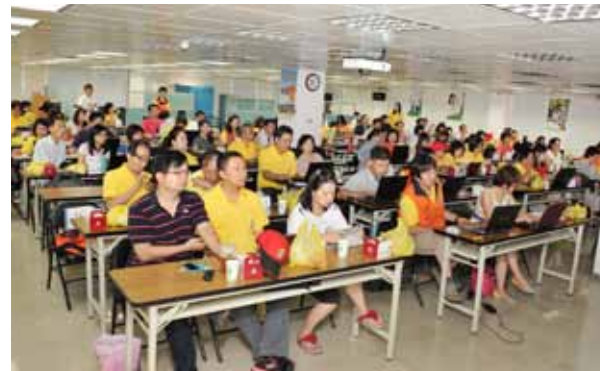
▲獅友們參加座談會認真聆聽講師指導。